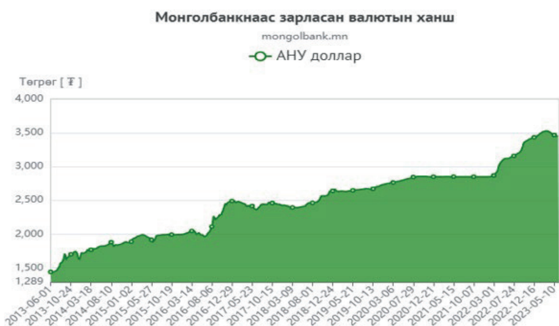
Зураг №1: Монголбанкны мэдээллийн сан дах валютын ханшийн мэдээлэл

Инфляц, валютын ханш, үнийн энэ өсөлтөөс үүдэн 2019 оноос хойших мэдээллийг авч үзвэл Монголын Хуульчдын холбоо сүүлийн 4 удаа бодит гүйцэтгэлээр гарсан хуульчийн мэргэжлийн шалгалтыг зохион байгуулахад гарсан илүү зардлыг хуульчийн гишүүний татварын мөнгөнөөс санхүүжүүлж ирсэн байгааг тусгайлан дурдаж байна.