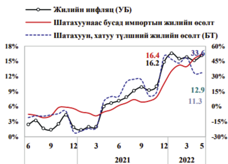
Зураг №4: Ерөнхий инфляц болон инфляцад өндөр нөлөөтэй бүтээгдэхүүнүүдийн жилийн өсөлт /хувиар/.

Үнийн өсөлтийн хувьд товч авч үзэхэд Монгол Улсад ерөнхий инфляц болон инфляцад өндөр нөлөөтэй бүтээгдэхүүнүүдийн жилийн өсөлтөөр авч үзвэл 2020 оны 12 сараас 2021 оны 12 сар хүртэл инфляц 3% өсөж 16.2% болсон буюу 13% орчим хувиар өссөн өндөр үзүүлэлттэй гарсан байна.